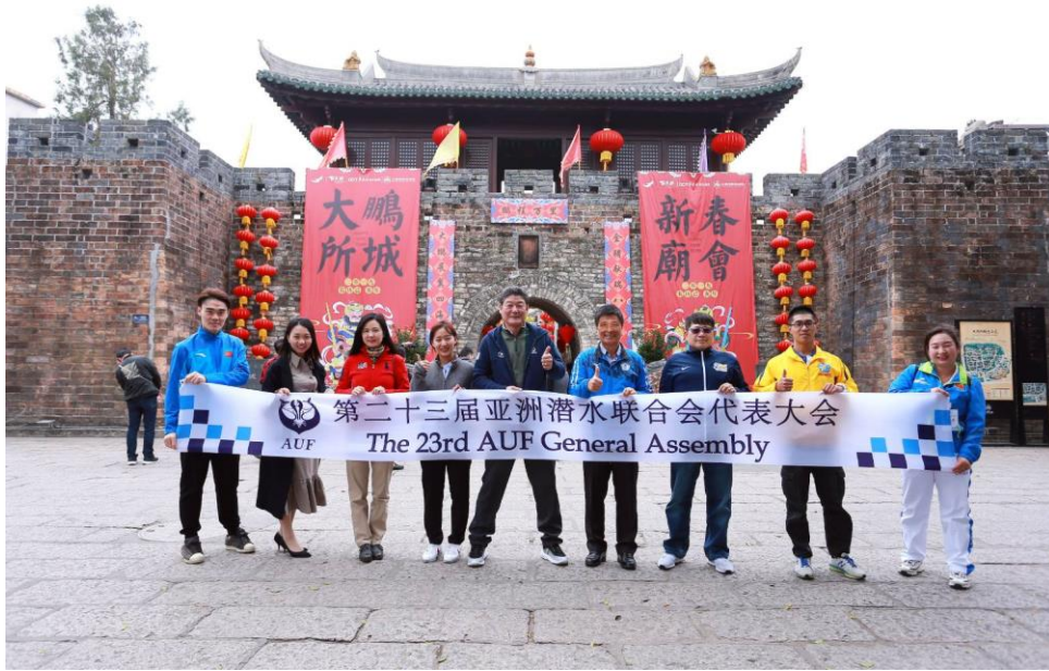
說明：於深圳大鵬所城實地考察合影