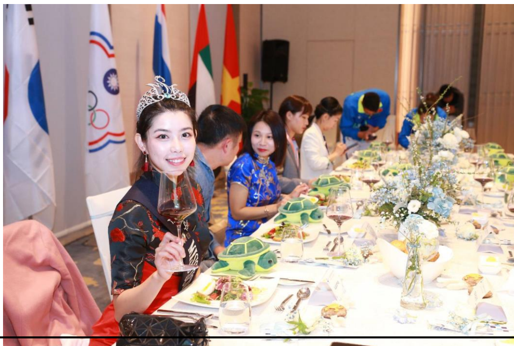
說明：晚宴高規格進行