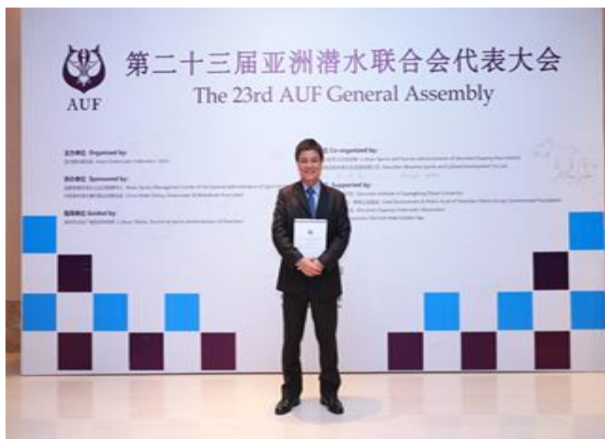
說明：亞洲水中運動聯盟中華台北代表應鉅理事長