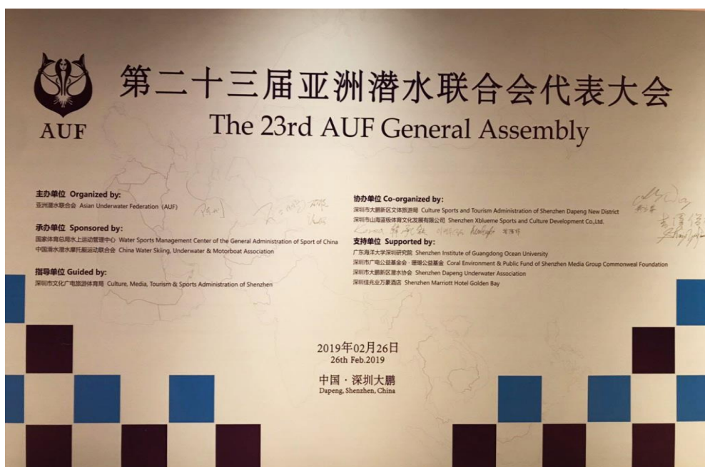
說明：2019 第 23 屆亞洲水中運動聯盟會員大會會議會議展板