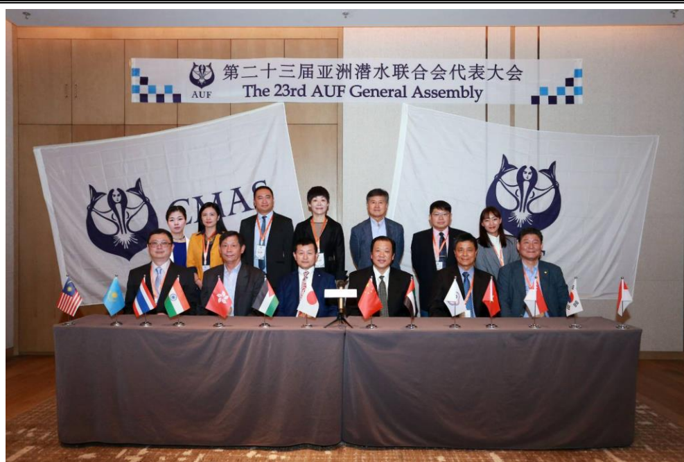
說明：2019 第 23 屆亞洲水中運動聯盟會員大會-大合影