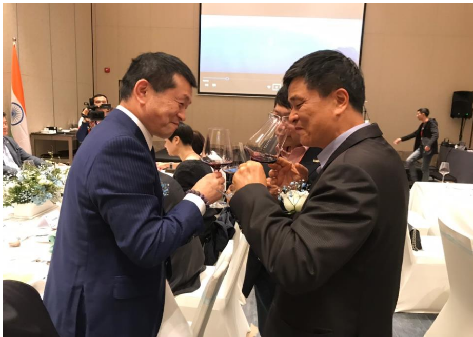
說明：與副主席（順吉）於晚宴互敬