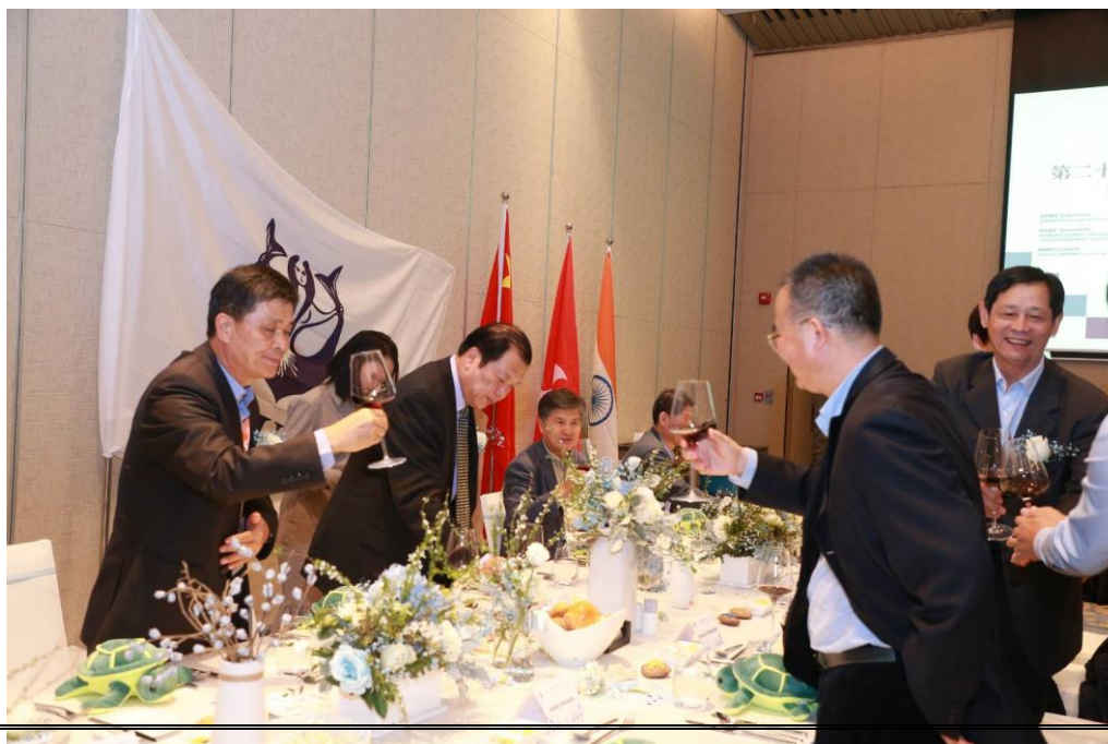
說明：晚宴上與大陸代表互敬