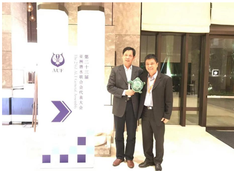
說明：與中國滑水潛水摩托艇運動聯合會主席許四海合影